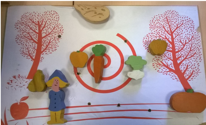
Le jardin d'Urbain à l'automne, matériel