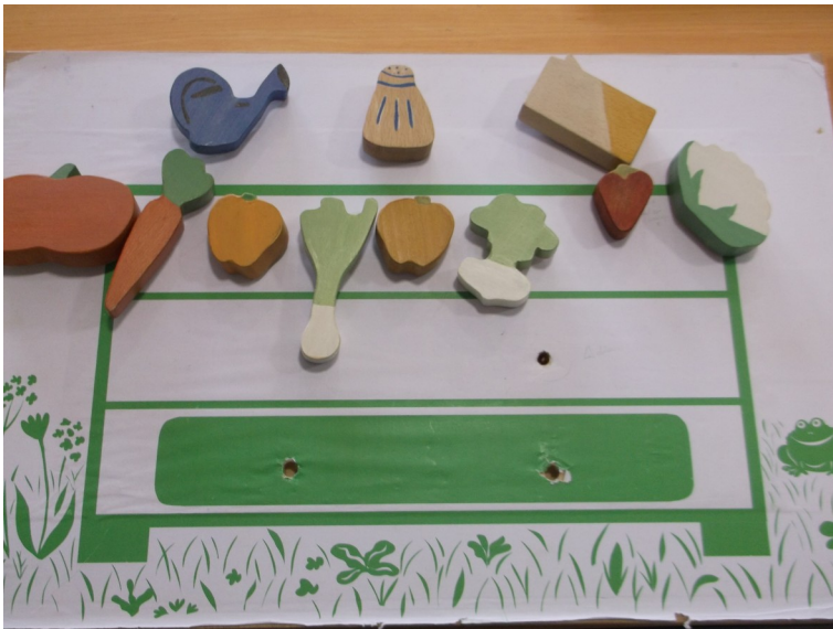
Plateau composteur avec toutes les figurines

- lorsque toutes les figurines sont triées, faire positionner aux enfants le lombric à l'étage médian du composteur, puis les deux plaques de compost dans le bas (elles s'encastrent comme un puzzle).