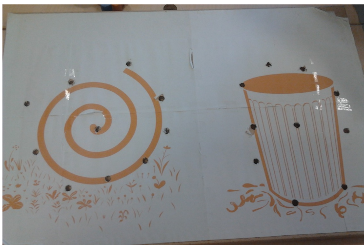
Gare à la poubelle – matériel – plaque du jeu