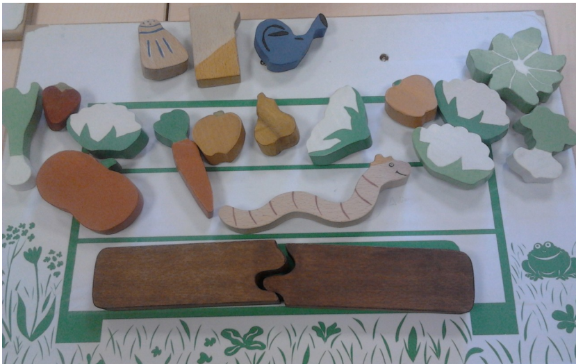
Vive le compost, matériel