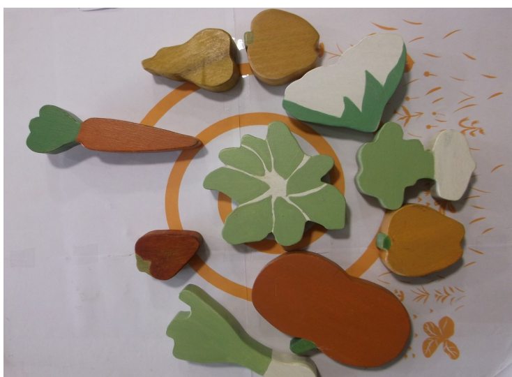
Gare à la poubelle – matériel – figurines utilisables