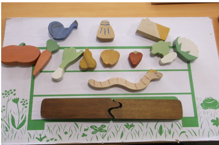
Plateau composteur ci-dessus + lombric + plaque de compost

- lorsque toutes les figurines sont triées, faire positionner aux enfants le lombric à l'étage médian du composteur, puis les deux plaques de compost dans le bas (elles s'encastrent comme un puzzle).