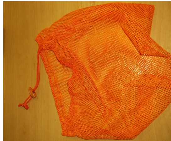
Sachet pour piocher