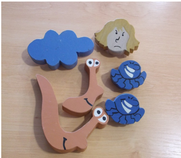
Figurines « pro-gaspi »

Gare à la poubelle, disposition des figurines au début du jeu (l'ordre de fixation des fruits et légumes n'importe pas : toutes les figurines peuvent être interverties)