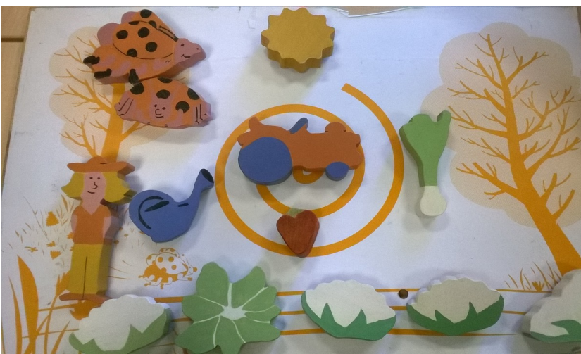
Le jardin d'Urbain à l'été, matériel