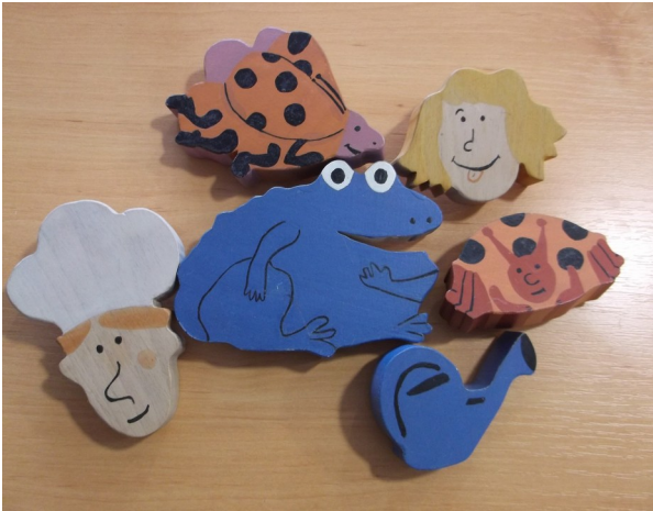
Figurines « anti-gaspi »