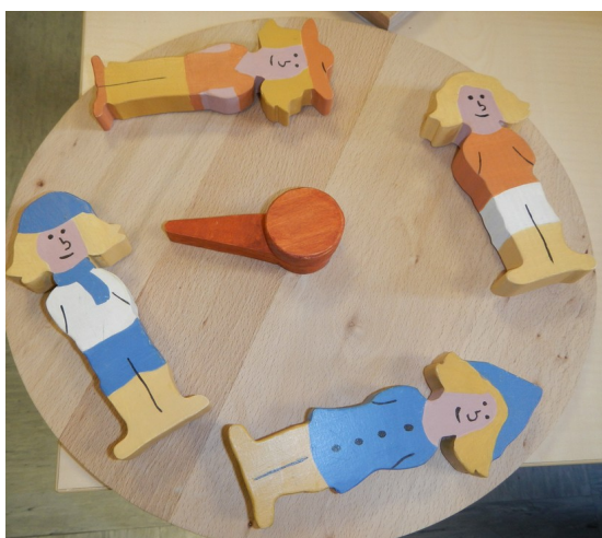
Roue des saisons