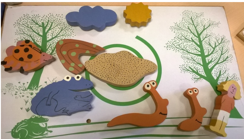
Le jardin d'Urbain au printemps, matériel