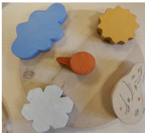
Roue du climat