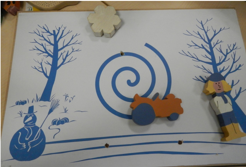
Le jardin d'Urbain à l'hiver, matériel